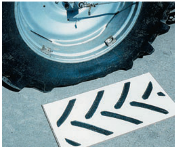
Felfekvő felület változása az abroncsnyomás csökkentésének hatására

barna erdőtalajon) megfelel 1 bar okozta talajtömörödésnek a talaj 20% (megmunkálhatósági határ) nedvességtartalma mellett.